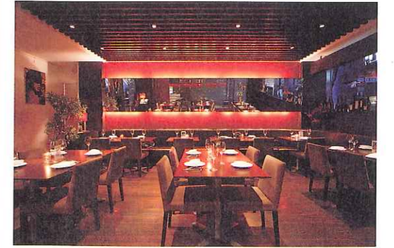
ロティ 六本木 (六本木) ①東京都港区六本木6-6-9 ビラミデビル1F 営業11:30~23:00 (L.O.22:00/全曜22:30) 無休 ☎03-5785-3671 www.roti.jp

肉のボリュームといい、ジューシーな焼き加減といい、まさにラムチョップの真髄を味わえる一皿。主役のラムは、数ある産地の中からそのとき一番良質なものを厳選。さらに、最上等の部位である鞍下の骨付き肉を使用する。肉は余分な脂を丁寧に除いたあと、バルメザンチーズとマスタード、ハーブの衣をつけて遠赤外線ですばやく焼く。熟練の技で見事な歯ごたえに焼き上げる。これだけで十分美味しいラムの味を一段と高めているのが、ワイルドベリーを赤ワインで煮込んだソース。豊潤なラムと甘酸っぱいソースが奏でる味わいの妙は必食の価値ありだ。2800円。