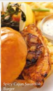
Spicy Cajun Swordfish Burger