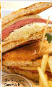
The Reuben Sandwich