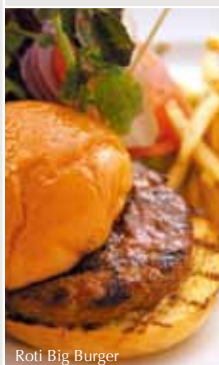
Roti Big Burger