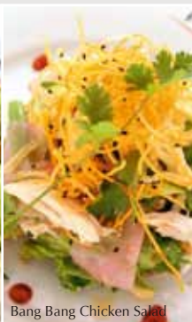
Bang Bang Chicken Salad