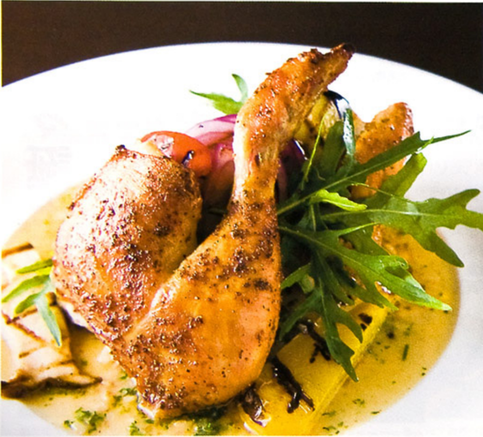
↑ロティ オリジナル ロティサリーチキン 1/2サイズ2200円。サイドディッシュとソースが選べる。